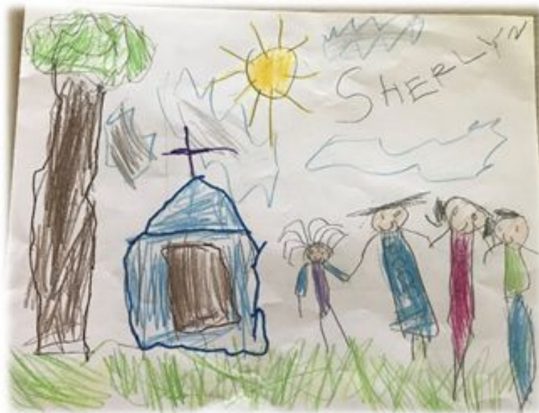
by- Sherlyn Raj