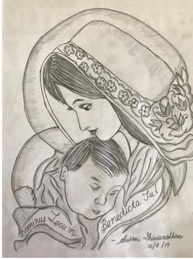
Illustration: Susan Dhivianathan